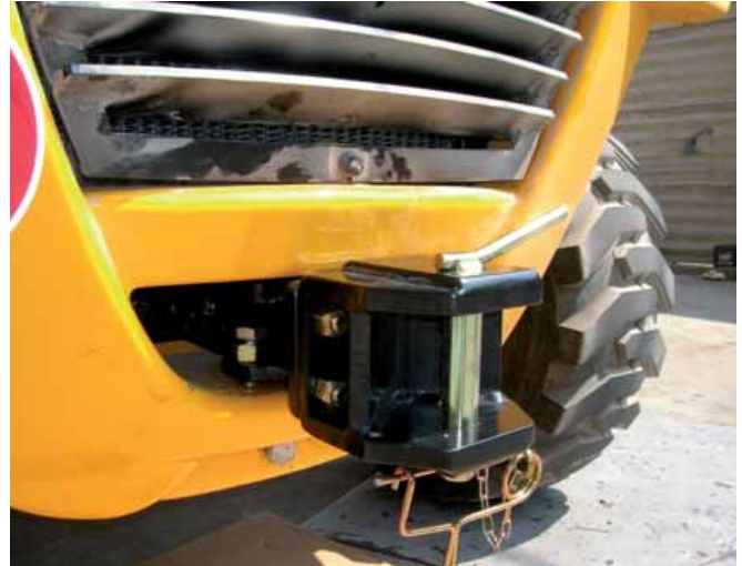
Gancio di traino categoria C (traino 6000 kg) di tipo "fisso", costruito per trattori con braccio telescopico, viene fornito come primo equipaggiamento.