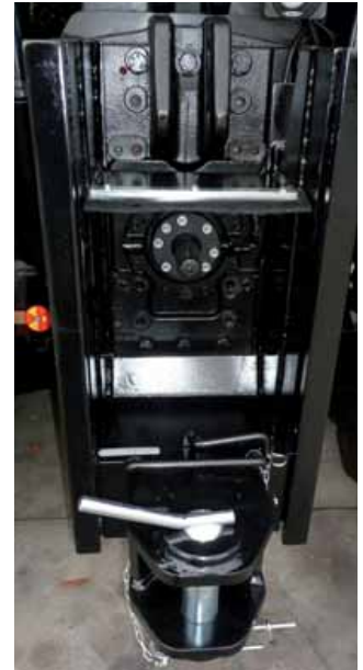
Gancio di traino categoria D3 che viene fornito assieme all'impianto di frenatura, aumentando la massa rimorchiabile fino a 20.000 kg.

Inoltre, affiancando la consueta produzione, installazione e collaudo degli impianti di frenatura la Malesani è oggi lieta di proporsi nel mercato