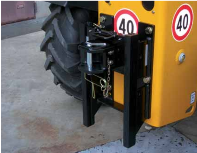
Gancio di traino categoria C (traino 6000 kg) di tipo "slider" a posizionamento rapido, costruito per trattori con braccio telescopico, viene fornito come primo equipaggiamento.

genza; - ganci di traino di piccole oppure grandi dimensioni a seconda la necessità del traino.